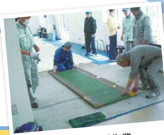
シートの清掃作業