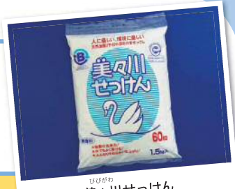
びびがわ 美々川せっけん

しゃかいふくしほうじん びびがわふくしかい 社会福祉法人 美々川福祉会 びびがわ 美々川エコ Tel 0144-57-0230 Fax 0144-57-0232