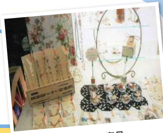
ハンドメイド商品