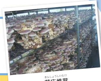
きんしょうしいたけ 菌床椎茸

しゃかいふくしほうじん びびがわふくしかい 社会福祉法人 美々川福祉会 びびがわ 美々川デイセンター Tel 0144-58-3300 Fax 0144-58-2558